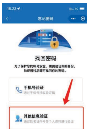
1-7 其他信息验证界面

1、注册会计师或非执业会员在身份验证时无法通过手机号找回密码，则可通过“其他信息验证”的方式找回密码。