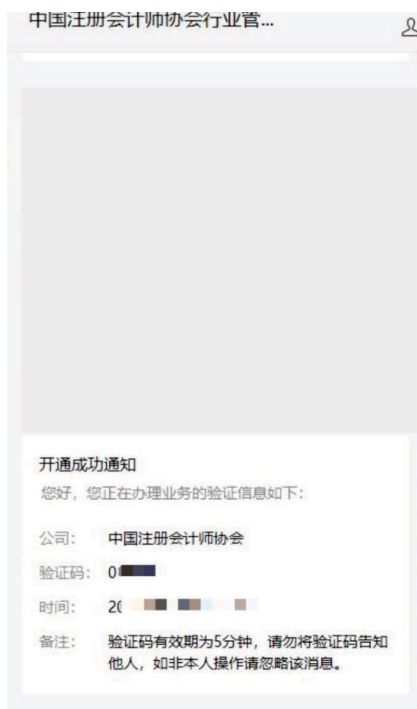
2-2 微信公众号验证码接收界面

2、个人会员在验证码接收界面点击获取验证码，验证码会发送到绑定的“中国注册会计师协会行业管理系统”微信公众号上。填写验证码后点击【下一步】跳转到新密码设置界面。