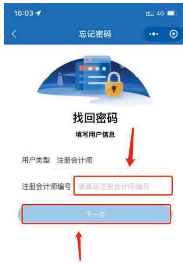
1-4 会员编号填写界面