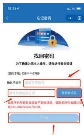
1-6 手机号验证码验证界面

2、填入完整的手机号码，点击获取验证码并输入验证码后点击【下一步】跳转到新密码设置界面。