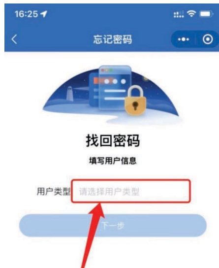
1-3 用户类型选择界面