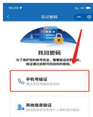
1-5 选择手机号验证界面

1、个人会员在信息验证时会员信息中留有正确手机号，可以通过手机号接收验证码方式找回密码。